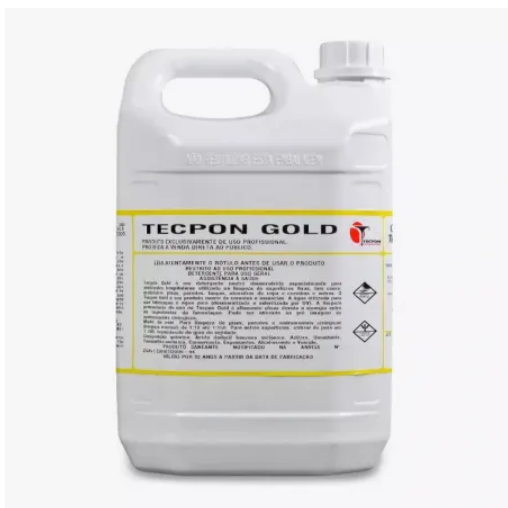
TECPON GOLD 5 LITROS