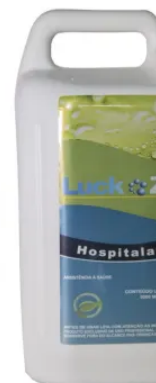
LUCKZYME HOSP ENZIMÁTICO 5 LITROS

R$ 175,66 à vista com desconto Pix - Vindi